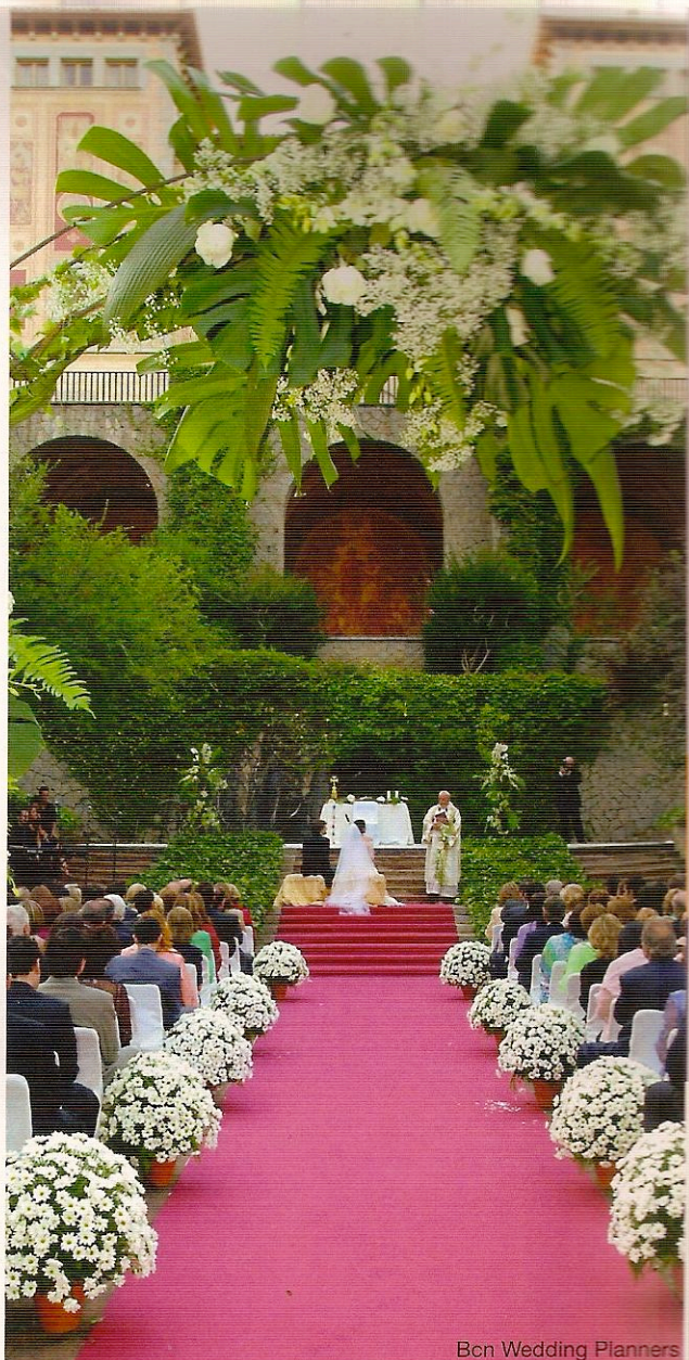
Bcn Wedding Planners

El grau de personalització de les cerimònies és tan gran que els wedding planners ja no només es limiten a coordinar cada detall del casament, sinó que en alguns casos, com a l'empresa Yes, I do , també desenvolupen una idea creativa associada a cada casament, i d'aquesta manera aconseguen un caràcter únic i personal per a cada enllaç. Moviments artístics, èpoques històriques com l'edat mitjana o inspiració musical són alguns conceptes que poden donar coherència a un casament i fer que sigui especial i diferent de la resta. També hi ha nuvis que volen donar un toc distintiu a la seva experiència i, per això, algunes agències són capdavanteres a l'hora de crear enllaços d'allò més distingits. És el cas d' Exclu-